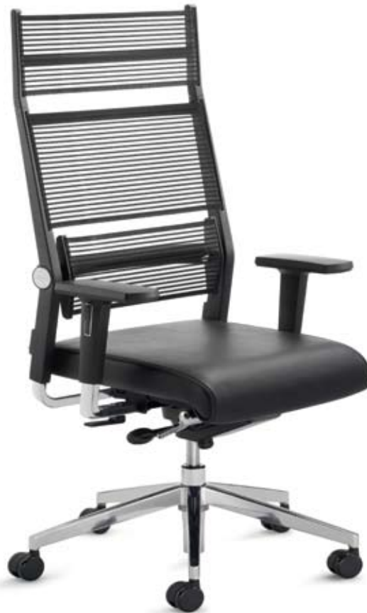
SD LO 33406 + Armlehnen 295 (mit Auto-Glide-System XL10= 10 cm Sitztiefenregulierung)