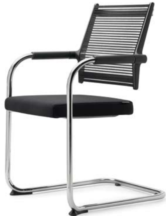
LO 33160 000 = stapelbar (LO 33150 001 = nicht stapelbar)