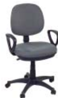
Drehstuhl H 305-3 59 Euro

Kippelig: Stuhl mit nur mäßigem Sitzkomfort und festen, zu niedrigen Armlehnen. Ist haltbar, aber die Verstellteile sind unhandlich und schwergängig. Vorsicht, nicht standsicher: Stuhl kann unter Belastung nach hinten wegkippen.