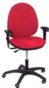
Ikea/Bonny 93 Euro

tung. Größtes Manko: Stuhl kippt unter Belastung seitlich und nach hinten weg.