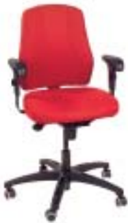
Ikea/Verksam 226 Euro