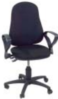
Topstar Point 60 109 Euro

Wollbezug. Schnell zusammengebaut, haltbar und standsicher. Aber Sicherheitsmanko: Gasfederhalterung teilweise scharfkantig.