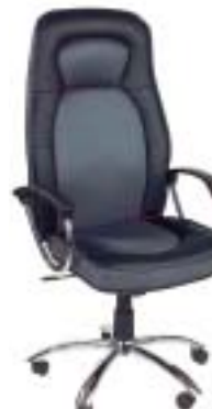
XXXLutz 139 Euro

fahr beim Einstellen, nach vorn nicht kipp-sicher, Gasfeder ist schlecht abgedeckt.