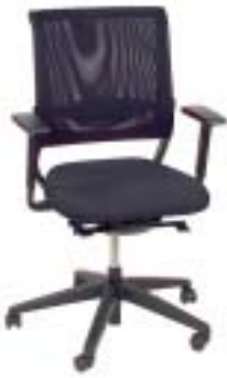
Sedus 510 Euro