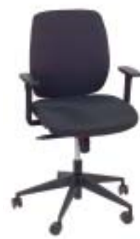
Rovo Chair 375 Euro

Der Bequeme: Teurer Stuhl mit vielen Verstellmöglichkeiten und guter Synchronmechanik. Bietet hohen Sitzkomfort mit guter Rückenabstützung und viel Bewegungsfreiheit, für kleine Nutzer ist die Sitzfläche aber zu tief. Ist sicher und haltbar und hat einen sehr guten Bezug.