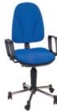
Topstar Ergo Steel 69 Euro

Unbequem: Stuhl mit einigen Verstellmöglichkeiten, aber nur mäßigem Sitzkomfort. Besonders Synchronmechanik und Rückenlehnenpolster sind ergonomisch ungünstig. Zusammenbau etwas mühsam, Klemmstelle an der Verstellmechanik unter dem Sitz.