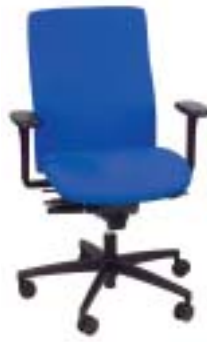
Trend!Office 375 Euro

Der Beste: Teurer und haltbarer Stuhl mit sehr gutem Bezug; für große und kleine Leute gut geeignet. Bietet hohen Sitzkomfort, viele Verstellmöglichkeiten und Synchronmechanik. Einfach einzustellen, vor allem die Gegenkraft (Anlehndruck) der Rückenlehne ist gut regulierbar.