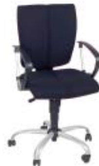
Nowy Styl Cinque 179 Euro

aber der Bezug ist wenig strapazierfähig. Größtes Manko: Die Armlehnen sind wenig belastbar.