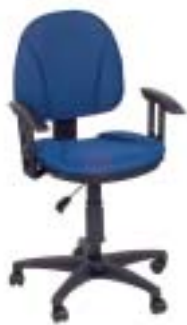
Höffner 49 Euro