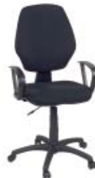
Nowy Styl Master 99 Euro

Viele Schwächen: Preisgünstiger Stuhl mit nur mäßigem Sitzkomfort. Sehr weich und wenig haltbar gepolstert, Winkel zwischen Sitzfläche und Rückenlehne ergonomisch ungünstig. Etwas mühsam zusammenzubauen, Armlehnen wenig belastbar und verbiegen sich schnell.