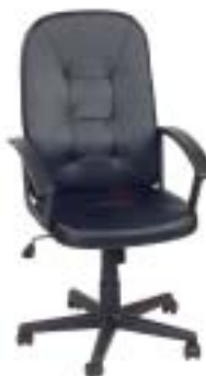
Roller 40 Euro