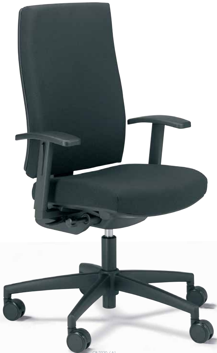
CB 2320 / A1

ceto basic is available in 2 different backrest heights. The models with high backrest are offered optionally with lumbar support.