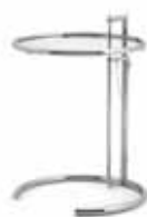
ADJUSTABLE TABLE E 1027 1927