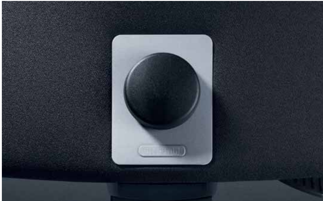
Geometrisch das Verstellrad für die individuelle Einstellung der Rückenlehnenhöhe: Präzisionsarbeit, reduziert und als schönes Detail hervorgehoben