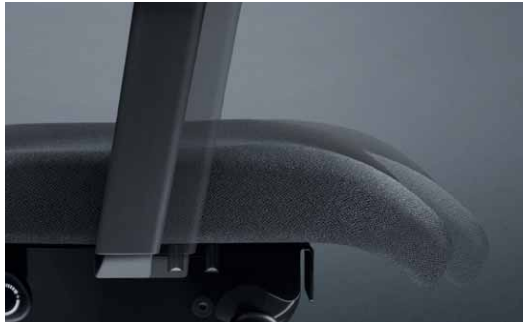
Sitztiefe und Sitzneigung können individuell mit einem Handgriff justiert werden