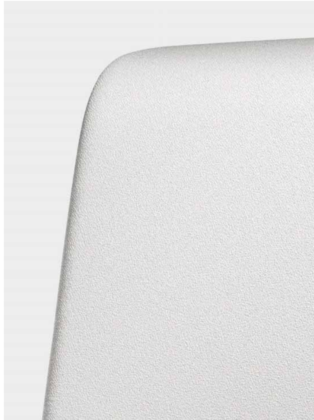
Der gepolsterte Rücken bietet hohen Sitzkomfort, ein angenehm bequemes Sitzgefühl und unterstützt den Rücken ergonomisch bestmöglich