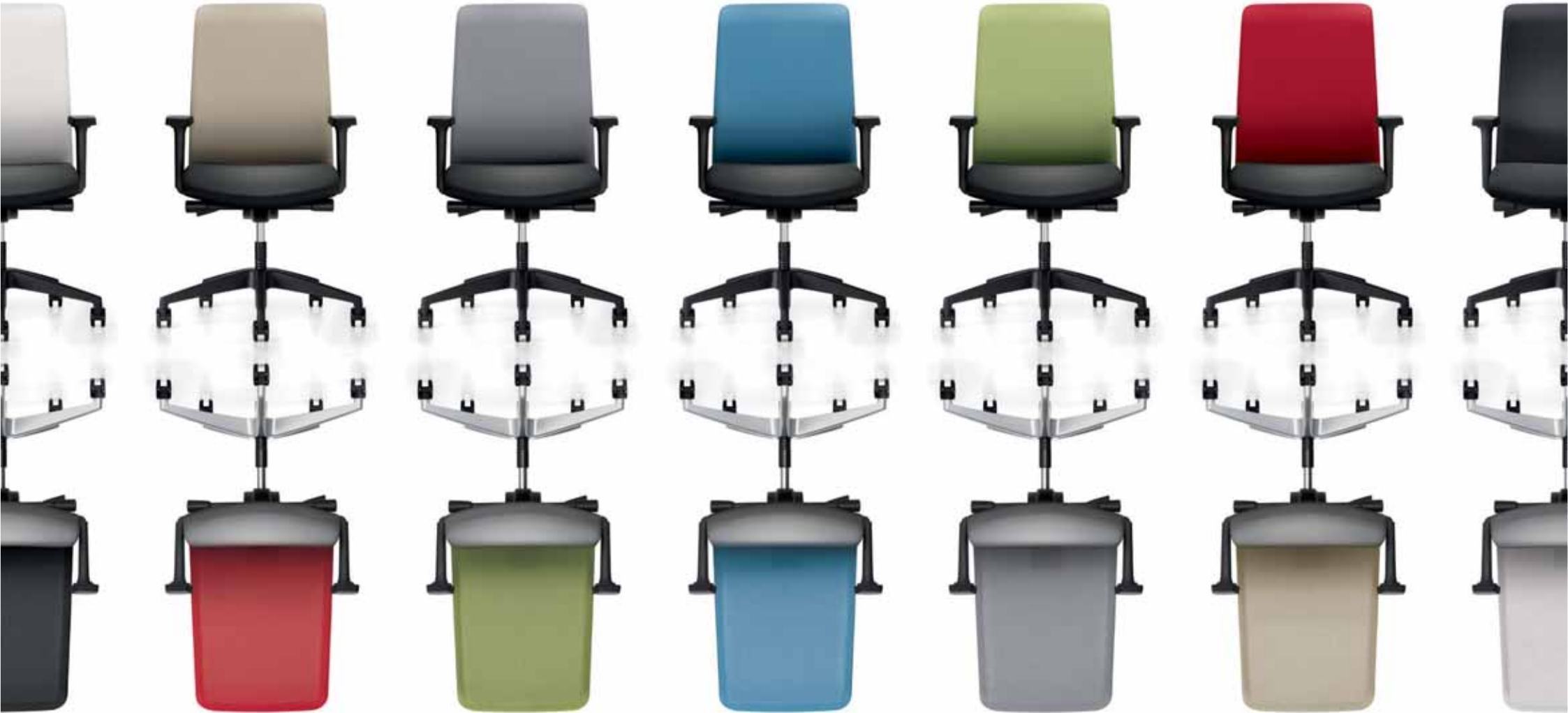
17C2 mit Netzurücken