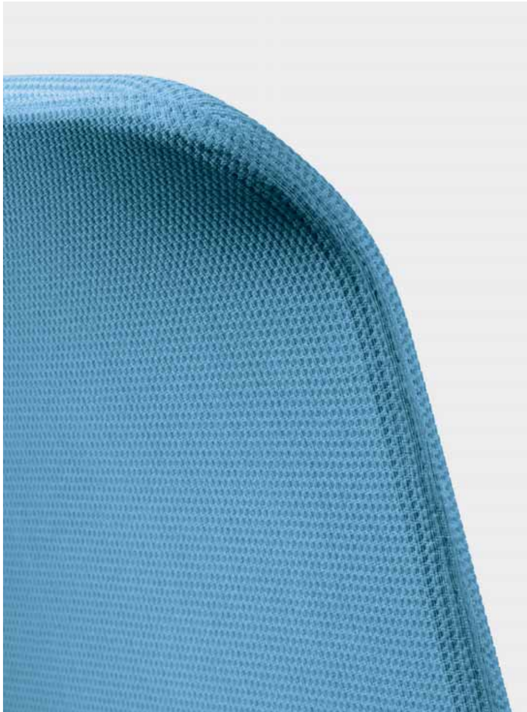
Das Netz der Rückenlehne ist besonders eng gewebt und durch seine Dopplung annähernd blickdicht – bietet dabei höchste Atmungsaktivität und passt sich der jeweiligen Sitzposition optimal an