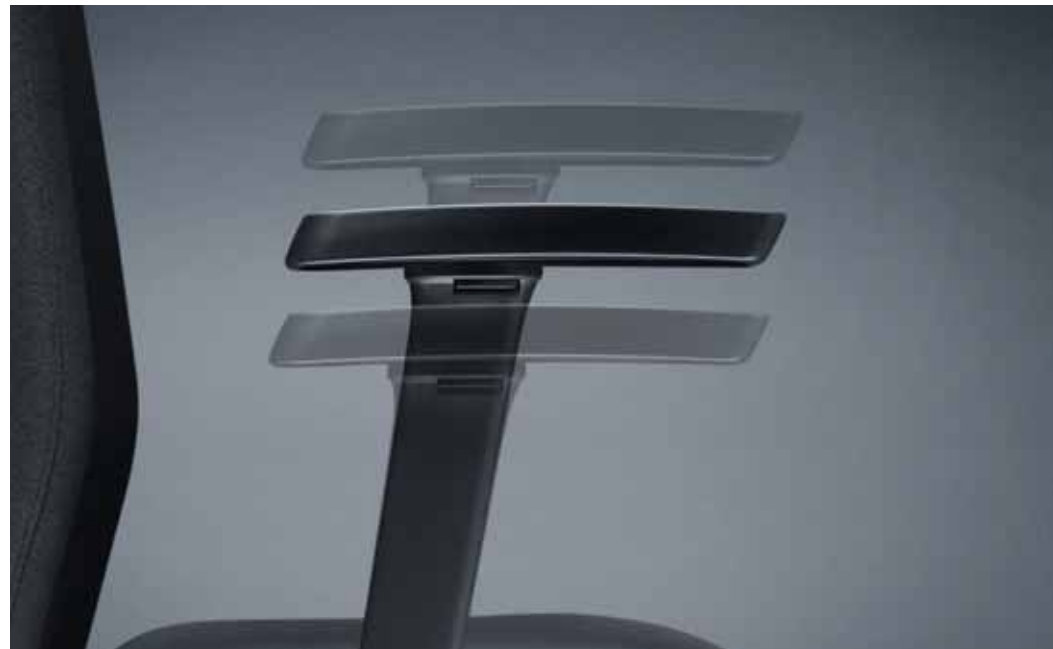
4D T-Armlehnen vierdimensional verstellbar, 2D T-Armlehnen höhen- und breitenverstellbar, beide mit weicher Auflage