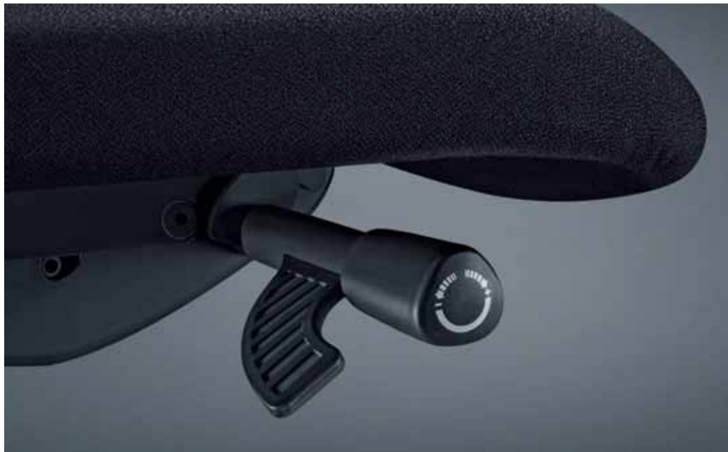
Großer und intuitiv bedienbarer Hebel für Gewichtsregulierung und SitzhöhenEinstellung