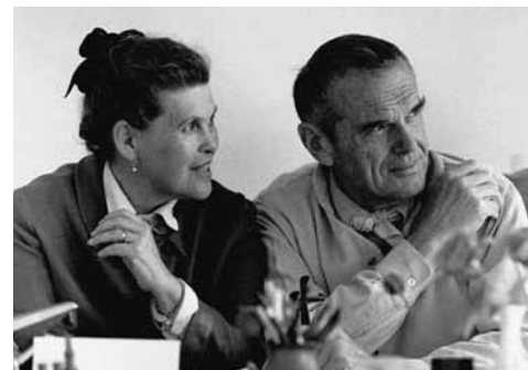
Charles & Ray Eames

Seit der Lounge Chair vor über 50 Jahren in Produktion ging, hat die durchschnittliche Körpergrösse je nach Region um bis zu 10 cm zugenommen. Um auch grösseren Menschen das Sitzerlebnis aussergewöhnlichen Komforts zu ermöglichen, hat Vitra in enger Abstimmung mit dem Eames Office die Dimensionen des Lounge Chair angepasst. Die Sitz- und Rückenschalen wurden dabei in ihren Proportionen so sorgfältig vergrössert, dass der Eames Lounge Chair in seinem optischen Gesamteindruck kaum verändert wurde.