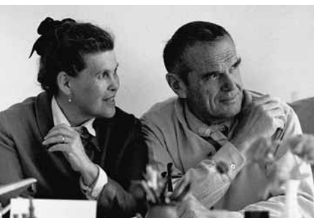
Charles & Ray Eames

Anlässlich des Wettbewerbs „Low Cost Furniture Design“ des Museum of Modern Art in New York präsentierten Charles und Ray Eames zum ersten Mal die Entwürfe der Plastic Chair Group. 1950 kamen der Plastic Side Chair und der Plastic Armchair dann als erste industriell gefertigte Kunststoffstühle der Geschichte auf den Markt. Weil die Eames in der Folgezeit verschiedene Untergestelle entwarfen, erweiterte sich der Einsatzbereich des Plastic Chair fortlaufend und er wurde zu einer Ikone des Möbeldesigns, die ausser im Wohnbereich auch in Büros, Praxen, Gaststätten, Hörsälen, Flughäfen oder Sportstadien millionenfach eingesetzt wurde und wird.