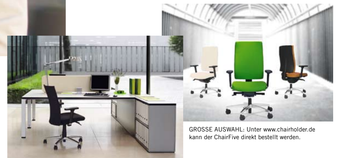
GROSSE AUSWAHL: Unter www.chairholder.de kann der ChairFive direkt bestellt werden.

Produkt: ChairFive Beschreibung: Bürodrehstuhl Anbieter: Chairholder GmbH Preis: ab 359 Euro (ohne Armlehnen) exkl. MwSt. Kontakt: www.chairholder.de FACTS-Urteil: sehr gut