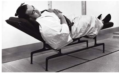
Der Sumo-Ringer Jesse Takamiyama auf der Soft Pad Chaise

Die leicht geschwungene Soft Pad Chaise entstand 1968. Diese Liege eignet sich besonders für kurze Pausen zur Entspannung im Büro oder zuhause. Sechs mit Reißverschlüssen verbundene Kissen sind auf dem Aluminiumrahmen befestigt, zwei lose Kissen sorgen für zusätzliche Bequemlichkeit.