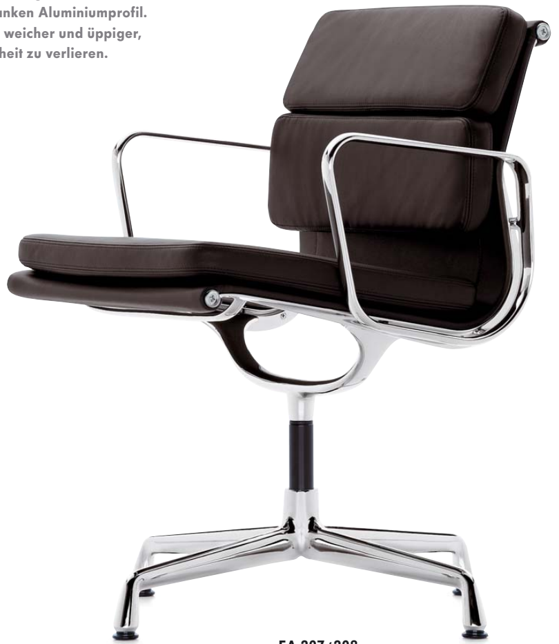
EA 207 / 208