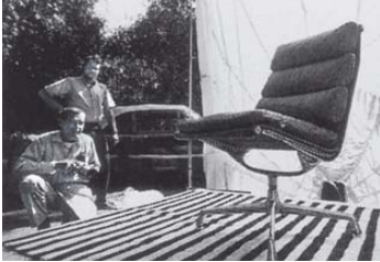
1969, Charles Eames und Mitarbeiter Alex Funke beim Fotografieren

Der Entwurf des Soft Pad Chair stammt aus dem Jahr 1969. In Konstruktion und Form gleicht er dem Aufbau des Aluminium Chair. Durch die aufgenähten Polster entsteht ein Kontrast zum schlanken Aluminiumprofil. Dadurch ist der Soft Pad Chair weicher und üppiger, ohne an Transparenz und Klarheit zu verlieren.