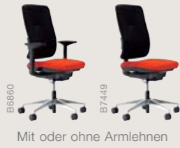
Mit oder ohne Armlehnen